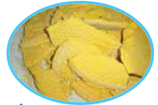
应用于淀粉厂 For Starch Industry