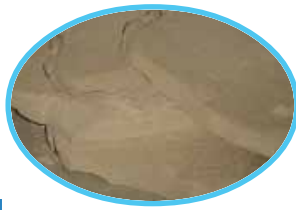
应用于甜菜碳法糖厂 For Beet Sugar Factory