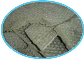
应用于甘蔗亚法糖厂 For Cane Sugar Factory