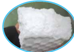
应用于甘露醇、山梨醇药厂 For Sorbitol Filtration